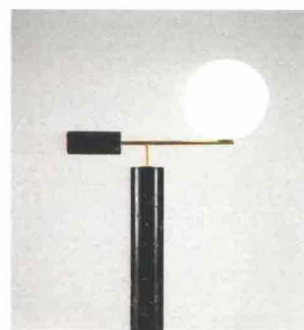
Lampada Flora in marmo e ottone, design e produzione Marcin Rusak.

UNA PALETTE FEMMINILE RUBATA AL MAKEUP, DOVE LE NUANCE DEL ROSA SI MISCHIANO AL GLOSS E ALL'ORO DI ROBERTO CIMINAGHI