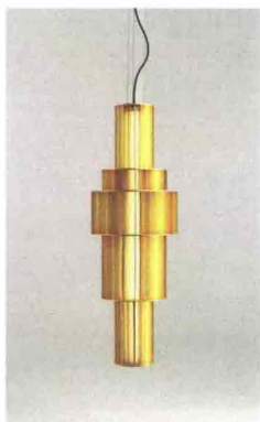
Lampada Babel, design Stephen Burk per Parachiina.