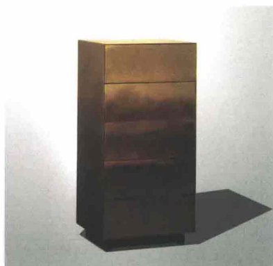
Cabinet Marea, in metallo ossidato, design Zanellato Bortolotto per De Castelli.