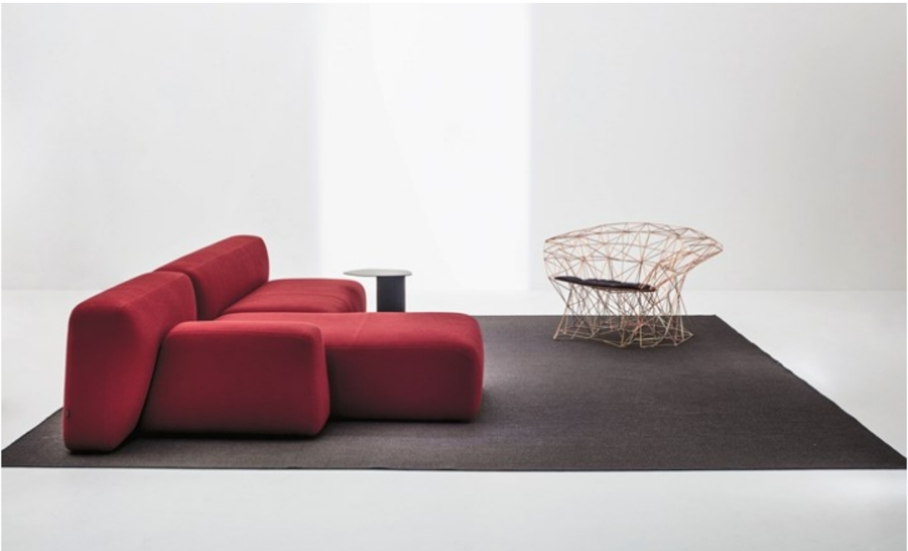
Filinea by LaCividina

Lo spunto per la poltrona Filinea è stato il particolarissimo aspetto dell'euphorbia tirucalli, una succulenta molto diffusa in Sud Italia e caratteristica della Sicilia di Antonino Sciortino, designer da sempre molto legato alle sue origini. I suoi rami sottili e intricati sono diventati le linee di un progetto impossibile, un groviglio di forme geometriche che s'intersecano tra loro per creare questa seduta aerea.