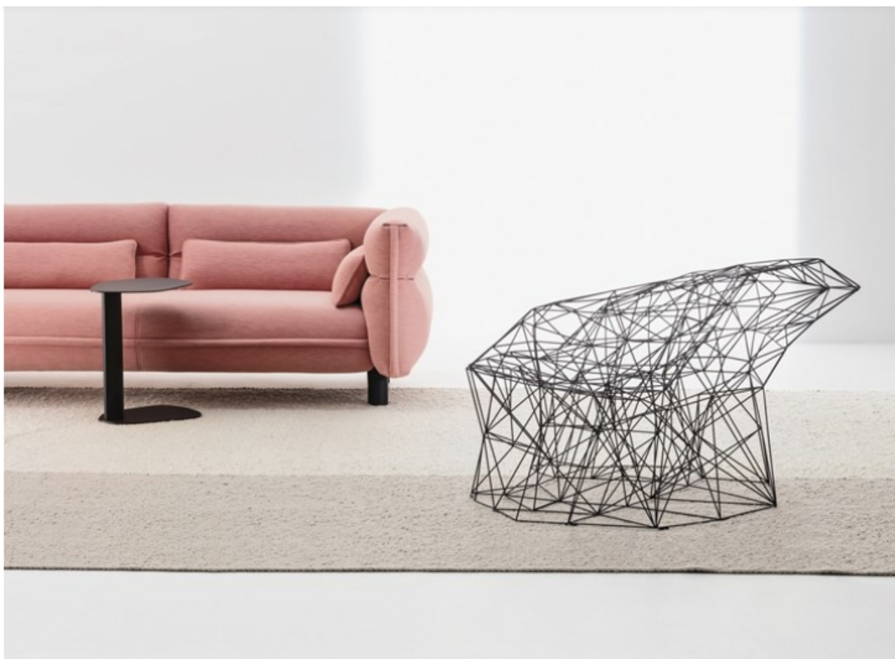
Filinea by LaCividina

LaCividina presenta la seduta futuristica firmata da Antonino Sciortino