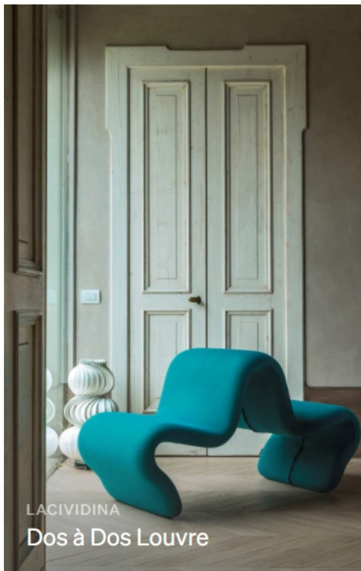
LACIVIDINA Dos à Dos Louvre

Le sue sedute più famose sono apprezzate come vere opere d'arte ed esposte nei più grandi musei internazionali.