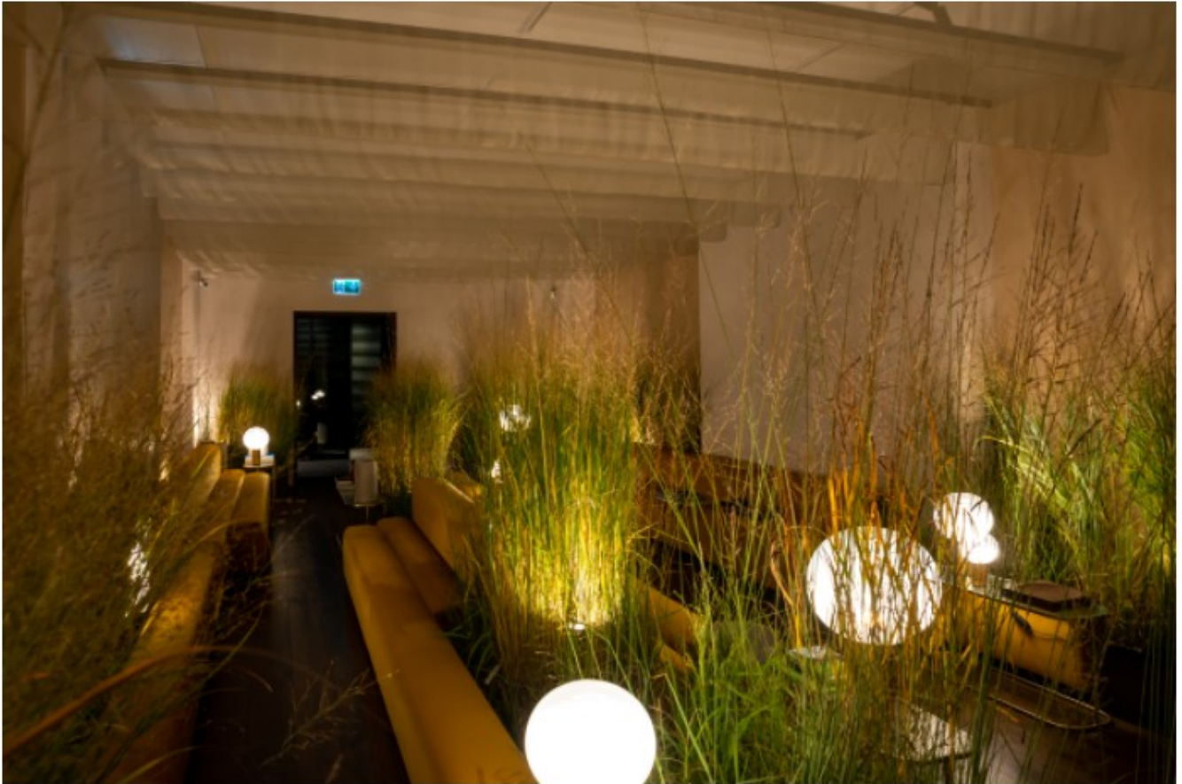
Osaka by laCividina, Design Pierre Paulin

In seconda battuta valutiamo quei designer che abbiano la mano adatta a laCividina e che anche caratterialmente possano entrare in armonia con l'azienda e che rappresentino il filo conduttore che noi abbiamo in testa. Le due personalità devono sviluppare reciproca empatia, il designer deve sapere come laCividina lavora anche dal punto di vista tecnico. Ci vuole tanto tempo, non prendiamo mai in considerazione proposte di tipo cataloghista. Nella storia de laCividina hanno lasciato il segno designer come Ron Arad , Patricia Urquiola , Marco Piva , Antonio Citterio , per citare i primi che mi vengono in mente, e che hanno portato esperienza e competenze che l'azienda ha fatto proprie.