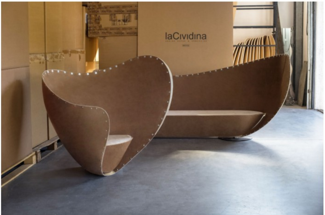
Mon Coeur collection by laCividina, Design Peter Harvey

La forma plasmata per laCividina da Fulvio Bulfoni è di quelle che si modificano nel tempo senza perdere nessun tratto delle proprie origini: nulla del passato viene dimenticato, tutto del possibile futuro viene considerato.