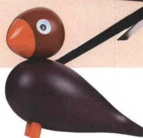
PIEPMATZ Jubiläumsvogel „Poppy“, ca. 70 Euro (kaybojesen-denmark.de)