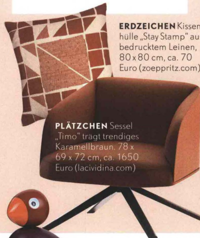
PLÄTZCHEN Sessel „Timo“ trägt trendiges Karamellbraun. 78 x 69 x 72 cm, ca. 1650 Euro (lacividina.com)

Er reiht sich unter so hochkarätigen Pritzker-Preisträgern wie Zaha Hadid oder Norman Foster ein: Kéré, der zwischen Berlin und seiner Heimat Burkina Faso wirkt, ist der erste afrikanischstämmige Gewinner. Als einziges von 13 Geschwistern besuchte Kéré eine Schule, erlernte die traditionellen Bauweisen Westafrikas und kam dann 1985 durch ein Stipendium nach Deutschland. Eine Schreinerlehre und ein Architekturstudium an der TU Berlin folgten – doch statt fortan prestigeträchtige Hochhäuser zu bauen, verschrieb er sich ökologischen und sozialen Projekten in Westafrika. Dort gestaltet er Schulen und öffentliche Gebäude wie das neue Parlament von Benin – alle mit regionalen Baustoffen und der Hilfe von lokalen Handwerkern errichtet. Wow!