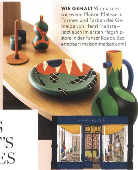
WIE GEMALT Wohnaccessoires von Maison Matisse in Formen und Farben der Gemälde von Henri Matisse – jetzt auch im ersten Flagshipstore in der Pariser Rue du Bac erlebbar